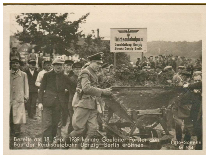
Ilustracja 1: Inauguracja budowy "gdańskiej autostrady" (1939)

Mniej więcej takiej treści artykuły ukazały się w lokalnej gdańskiej prasie. Informowały o wydarzeniu które dzisiaj po prawie 83 latach jest praktycznie nieznane. Możliwe że głównym powodem był niefortunny czas tego wydarzenia - wciąż trwały działania wojenne przeciwko Polsce i temat był już jedynie lokalną ciekawostką, która nie zapisała się jakoś szczególnie mocno w ludzkiej pamięci. O jaką "autostradę gdańską" chodziło? Najbardziej znany nawet obecnie (to jest w roku 2022) projekt autostrady Berlin-Królewiec był już w realizacji od roku 1934. W roku 1939 w rejonie Gdańska nie prowadzono żadnych prac z nim związanych, a w dodatku jego przebieg zaplanowano około 15-20 km na południe od miasta - więc to nie było to. Wstępne i lakoniczne informacje na ten temat podaje treść tablicy informacyjnej jaka była ustawiona na miejscu uroczystości. Widać ją na nielicznych fotografiach jakie wykonano w czasie trwania tej uroczystości. Jedną z nich wykorzystano jako powszechnie dostępną kartkę pocztową - zwiększało to więc szanse na jej zachowanie i dostępność nawet po długim czasie. Jej reprodukcję przedstawia poniższa ilustracja: